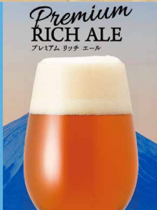
Premium RICH ALE プレミアム リッチ エール